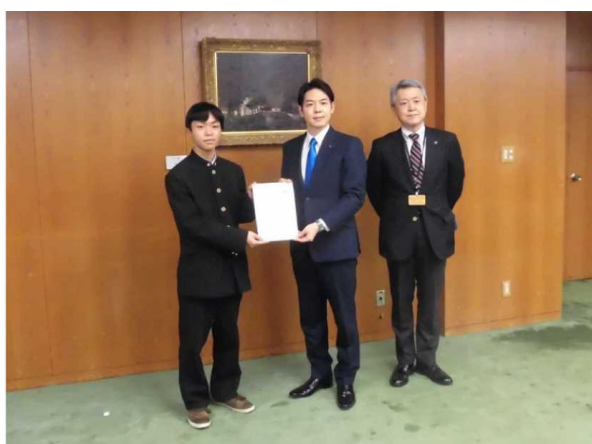
北海道子どもの未来づくり審議会 「子ども部会」(北海道)